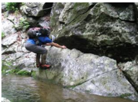
力強い蟹の横這い