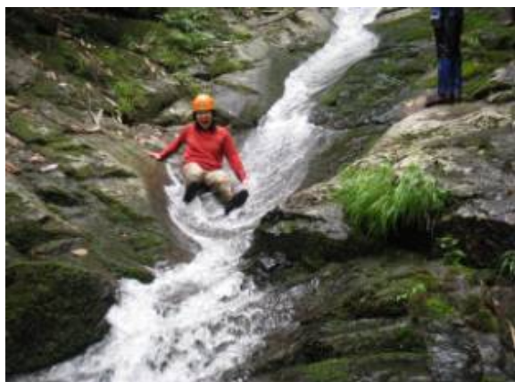
笑いが止まらない