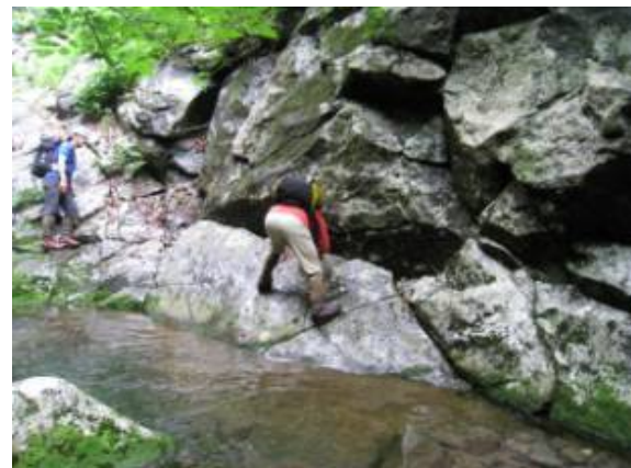
不安そうな旦那さんの目 その後は？