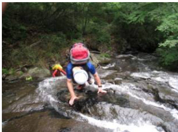
八幡滝から続く長い滑滝を登る