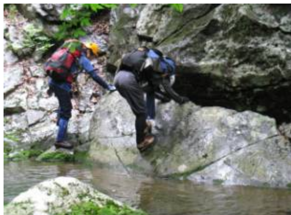
絶妙なバランスで蟹の横這い