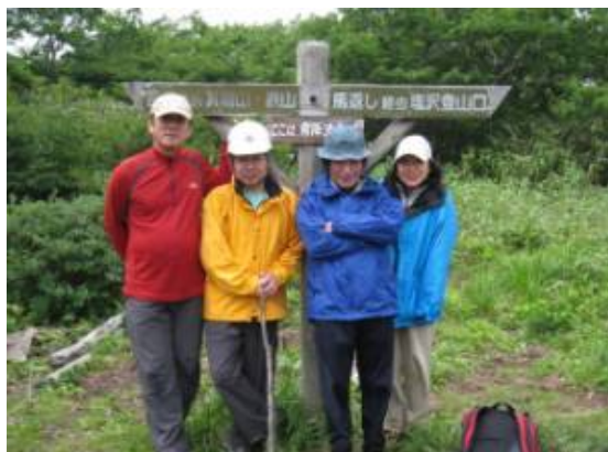
今日の遊びはここでおしまい 記念撮影